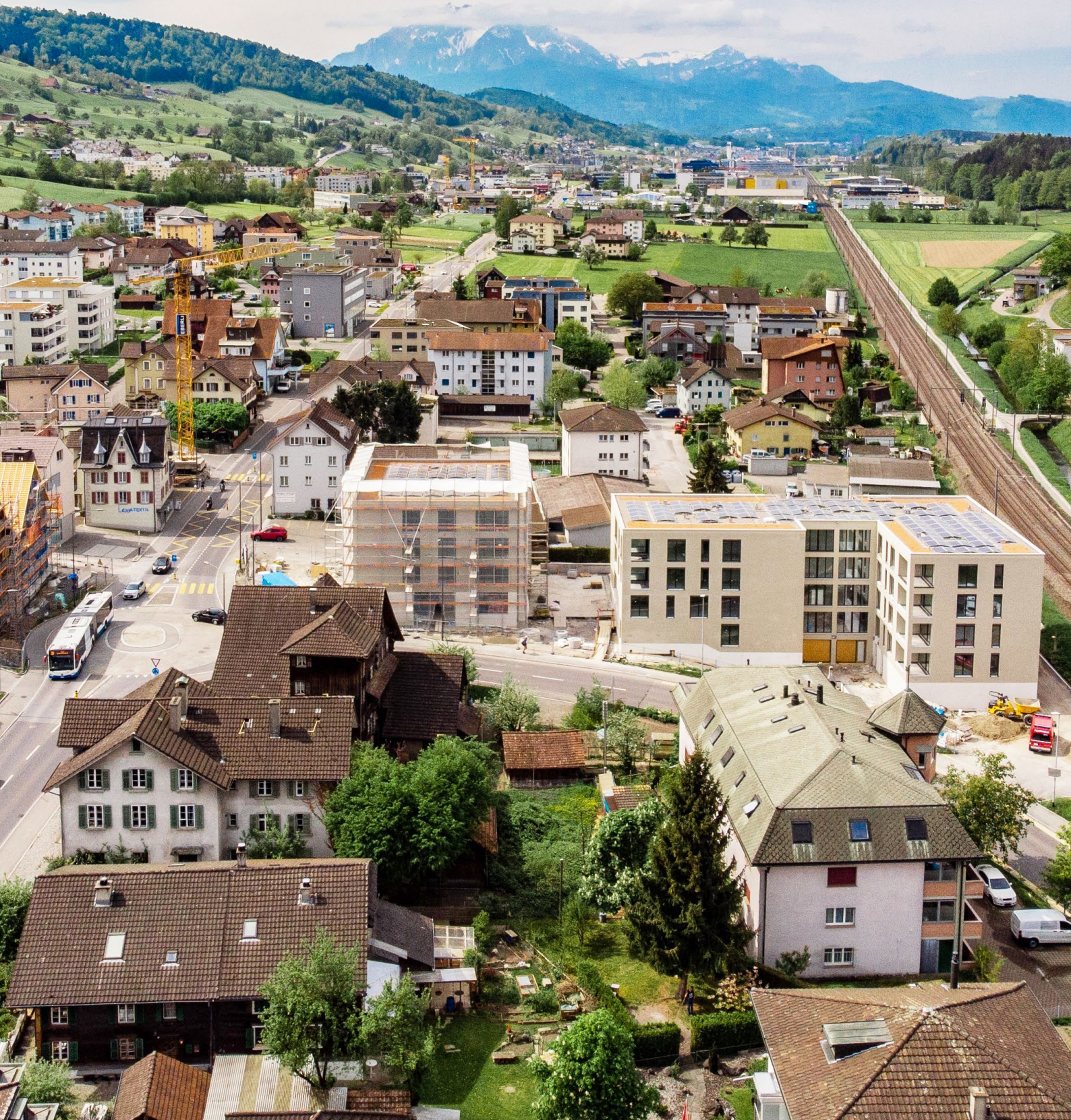
Blick auf die Rössli Baustelle mit dem Dorf Huus und Pilatus im Hintergrund, Ende Mai 2018